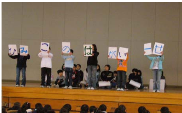
[ 佐久市中佐都小学校での実施風景 ]

学校歯科医、歯科衛生士、養護教諭をはじめ学校の先生方の協力により「こども8020推進員ノート」に基づく学習と、各校で創意工夫した講義を実施しています。大人になっても「歯の大切さ」を意識し、いつまでも健康を保つために「歯の健康管理」を継続して欲しいと願って、認定書とバッジを交付しています。