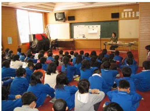
[ 飯山市立飯山小学校での実施風景 ]

内容詳細については、8020推進だよりNo.5 及び 信州歯報3月号(第527号)に掲載されています。